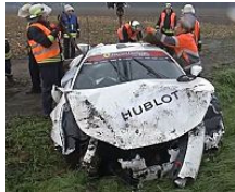
Bielefelder fährt Ferrari zu Schrott