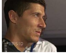
FCB: Lewandowskis Rückkehr nach Dortmund