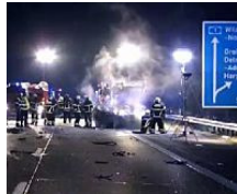
Schwerer Unfall auf der A1 – Fahrer stirbt in Flammen