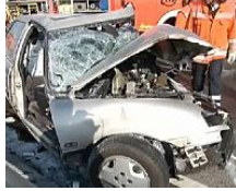
Falschfahrer stirbt bei Unfall auf der A 2