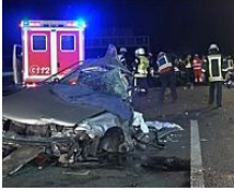
Tödlicher Unfall bei Rheda-Wiedenbrück